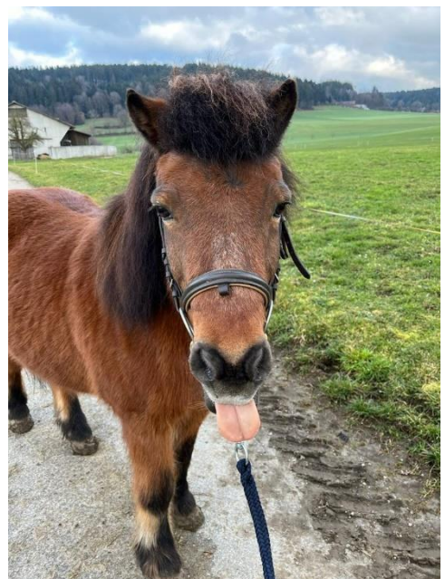
Spaziergang mit Chili

Um 14:15 Uhr startete ich wieder mit der Arbeit. Ich erledigte eine Wäscheladung und bereitete einen Brotteig zu. Währenddessen der Brotteig aufging, konnte ich mit dem Pony Chilli an die frische Luft spazieren gehen. Nach dem Spaziergang backte ich das Ruchbrot. Anschliessend war es schon fast 18:00 Uhr und ich tischte das Abendessen